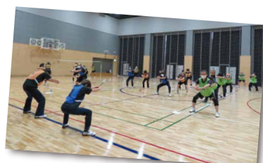
スポーツ推進委員体操

また、研修終了時には、電子ホイッスルが全員に配付されました。新型コロナウイルスの拡大防止対策をしていくなかで、活動するには絶対必要なアイテムになります。私達と一緒に大いに活躍することでしょう。